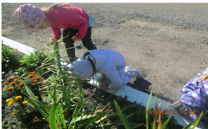
Изучаем почву на клумбе.

Изучаем почву на тротуаре. Педагог совместно с детьми рассматривает и сравнивает почву. Обобщаем полученные знания, делаем выводы.