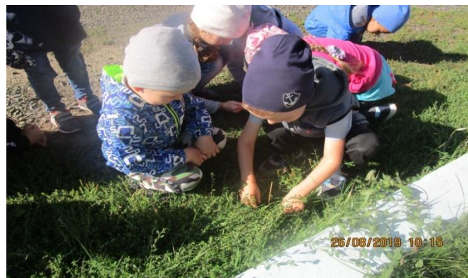
Изучаем почву на газоне.